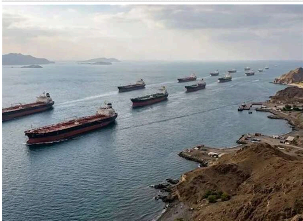
«Пан або пропав» для Білого дому: танкери змінюють курси через оголошену Трампом блокаду Ормузу

Після оголошення командуванням США операції з блокування всіх суден, які прямують з Ірану або до нього, нафтові танкери вже змінюють маршрути. Трампа очікує серйозне випробування: блокада може позбавити Іран головних козирів, або ж він зазнає поразки.