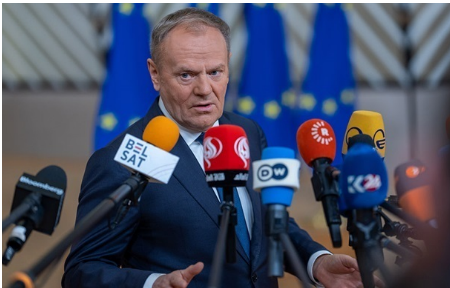
Дональд Туск переживає за єдність НАТО

Найбільшу загрозу для трансатлантичного співтовариства становлять не зовнішні вороги, вважає Дональд Туск.