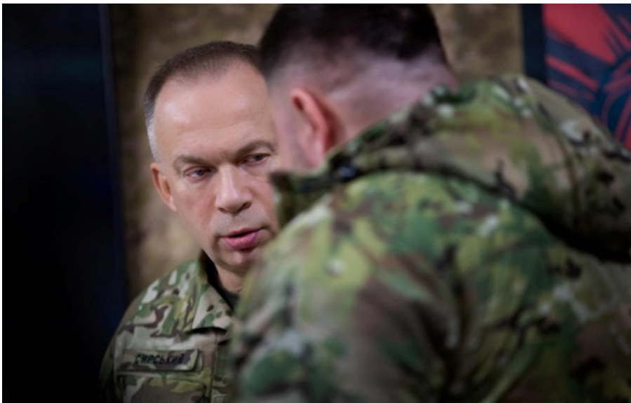
Олександр Сирський під час однієї з поїздок на фронт

У Костянтинівці триває режим контрдиверсійних дій. У місті проводяться активні заходи з виявлення та знищення противника.