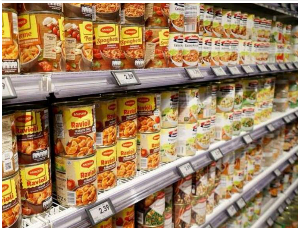
30 мільйонів євро на старт: уряд Німеччини змінює модель зберігання продовольства на випадок надзвичайних ситуацій

Німецький уряд зберігає запаси харчових продуктів у понад 150 секретних місцях, щоб забезпечити виживання населення у кризові часи. Міністр продовольства Райнер тепер хоче розширити цей резервний запас – коштом консервів.