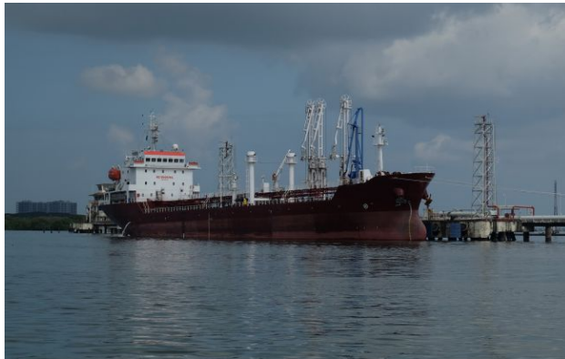
Фото: Росія стала основним постачальником нафти до Сирії

Обирайте перевірене - додайте РБК-Україна до улюблених джерел у Google