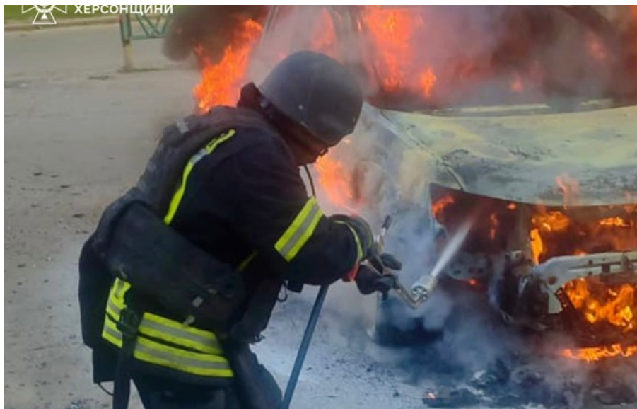
Наслідки російської атаки

Бригада медиків доправила до лікарні жінок віком 76, 47, 84 роки та 47-річного чоловіка. Усі вони зазнали уламкових поранень, контузій, вибухових та закритих черепно-мозкових травм.