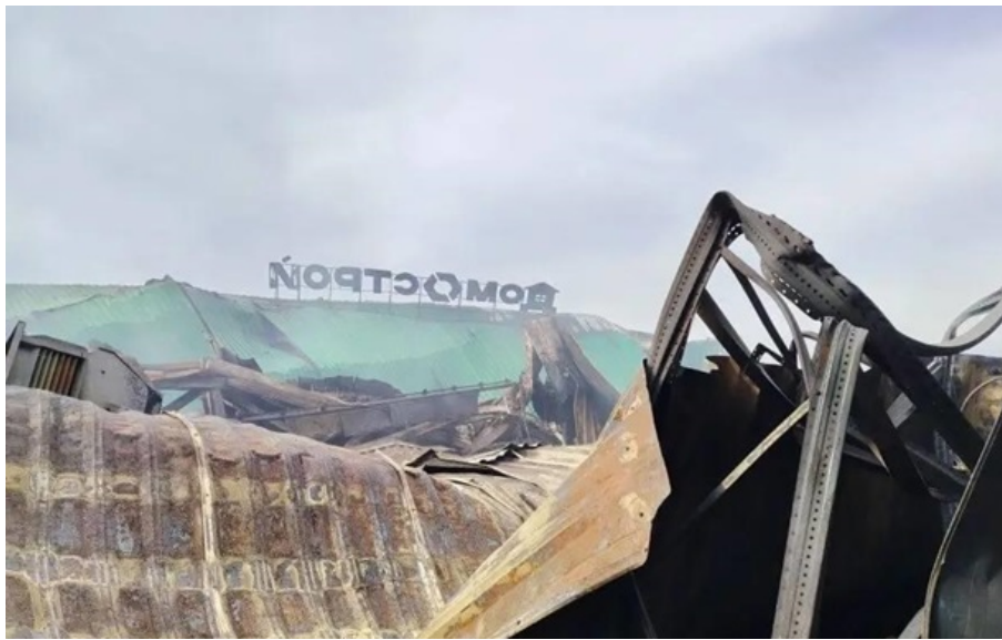
У ТРЦ Апельсин сьогодні "вихідний"

Пожежу локалізували на площі 5 тис. кв. м, але покрівля не витримала і обвалилась по всьому периметру торгового центру.