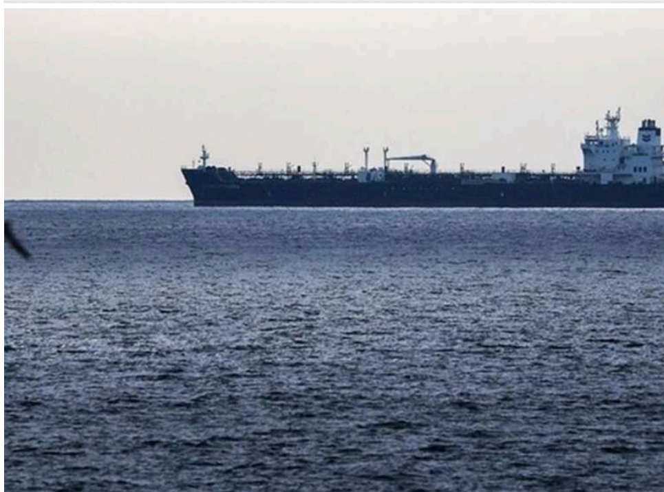
Китай ігнорує блокаду США: Пекін продовжить постачання енергоносіїв з Ірану під захистом власного флоту

Китай чітко дав зрозуміти, що продовжить користуватися Ормузькою протокою, виконувати енергетичні контракти з Іраном і підтримувати присутність свого флоту в цьому районі, попри блокаду з боку США.