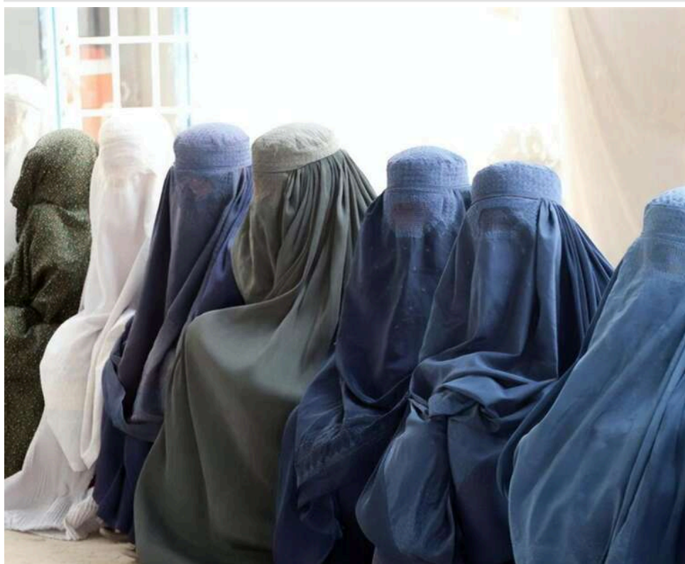
Талібан заборонив презервативи та обмежив доступ до контрацептивів в Афганістані

У Афганістані заборонили презервативи й обмежили жінкам доступ до протизаплідних пігулок, – ЗМІ.