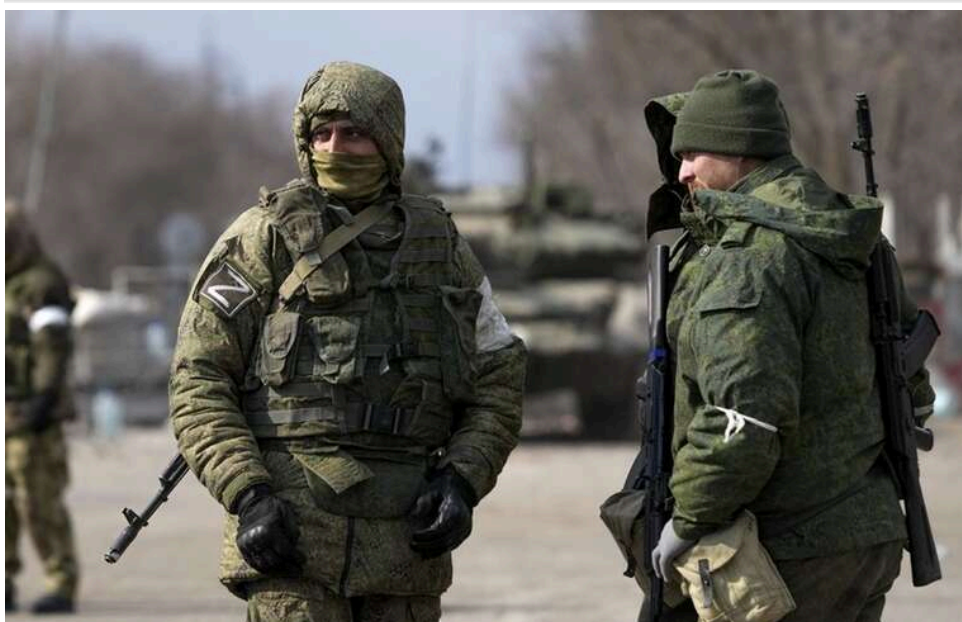
Ліквідували власних поранених: у районі Часового Яру війська РФ атакували групу росіян під час «режиму тиші»

У районі Часового Яру російські військові атакували своїх поранених бійців.