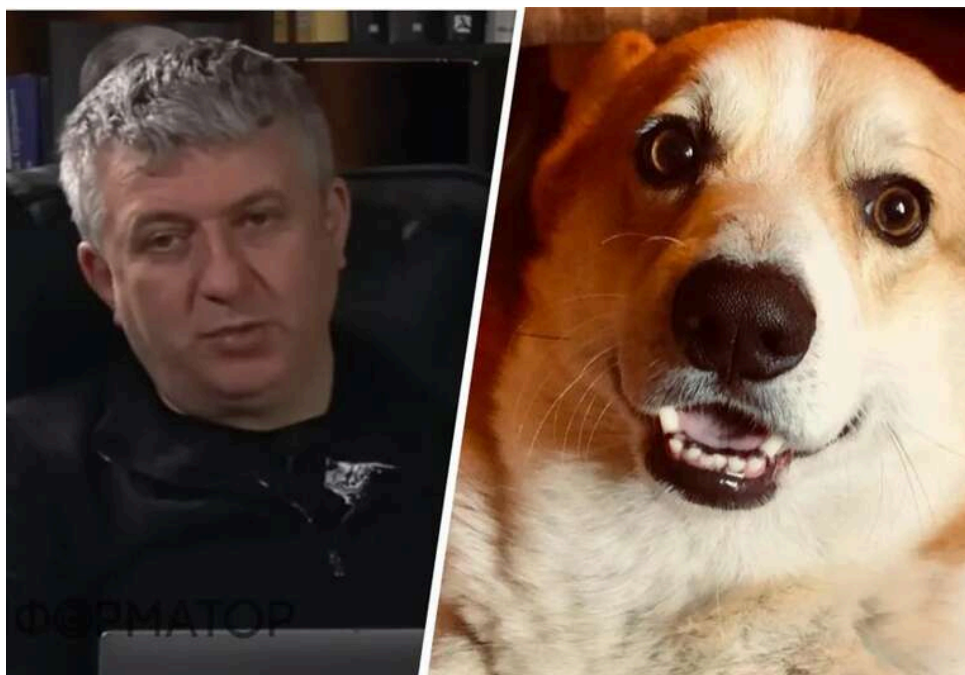
Рік умовно за вбитого коргі: суд виніс вирок сусіду журналіста Юрія Романенка, який застрелив собаку

Завершився судовий розгляд резонансної кримінальної справи про вбивство домашньої тварини. Вирок пролунав на тлі широкого суспільного обговорення жорстокого поводження з тваринами в Україні. Чоловік, який застрелив коргі Беста - домашнього улюбленця родини відомого журналіста Юрія Романенка, - отримав один рік обмеження волі та один рік умовно. Сам Романенко визнав, що підсудний відбувся відносно легко, і оголосив про початок наступного етапу боротьби за справедливість.