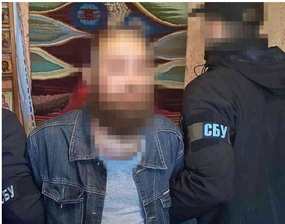
5 років тюрми за координати ППО: на Сумщині засудили коригувальника, який працював на ворога за церковні книги

Шосткинський міськрайонний суд Сумської області визнав чоловіка винуватим у незаконному поширенні інформації про розташування Збройних сил України.