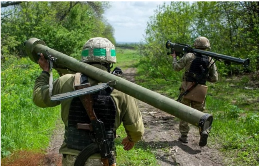
У підрозділів ППО сьогодні багато роботи

Зафіксовано влучання 16 ударних БПЛА на шести локаціях, а також падіння уламків ще у 11 місцях.