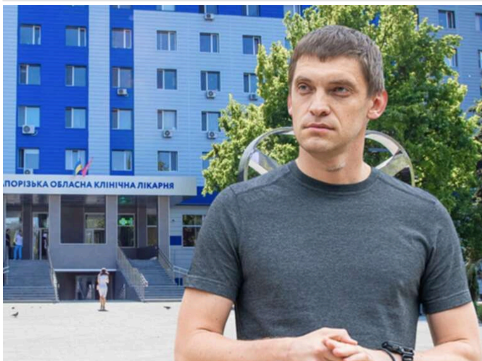
Бізнес батьків під крилом ОДА: як фірма родини Івана Федорова заробляє мільйони на державній лікарні

Журналісти SODA повідомили, що компанія батьків голови Запорізької ОДА Івана Федорова отримує мільйонні замовлення від державної лікарні на послуги, які та могла б надавати самостійно.