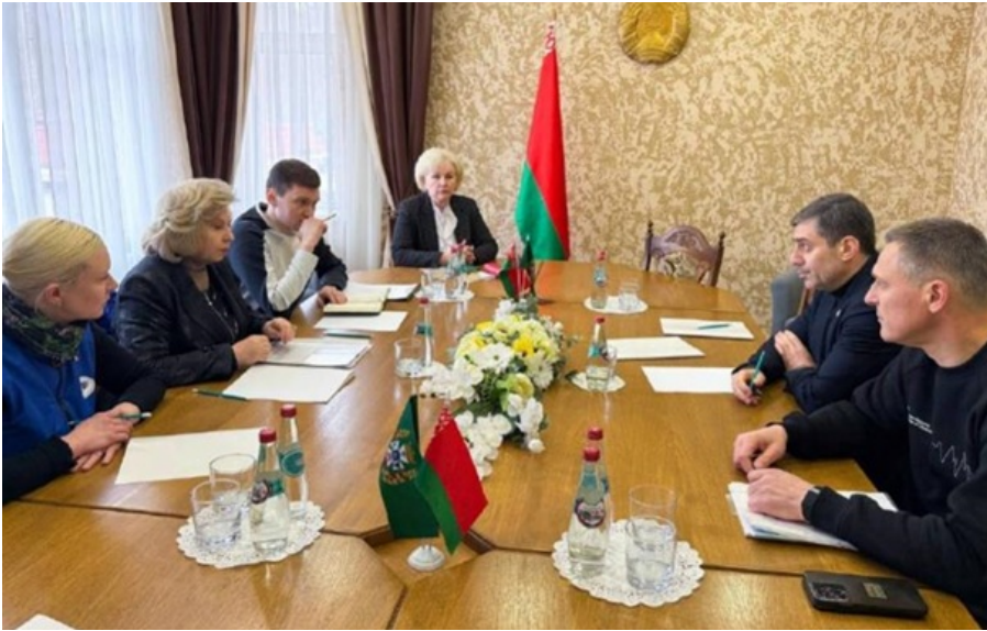
убінець розповів про зустріч із Москальковою

Під час зустрічі сторони обговорили верифікацію та повернення військовополонених і незаконно утримуваних цивільних осіб, а також передали листи від військовополонених їхнім родинам.