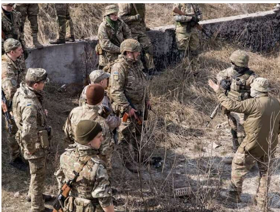
Ситуація на фронті: Зафіксовано 138 боєзіткнень, найзапекліші бої тривають на Покровському, Костянтинівському та Гуляйпільському напрямках

Захисники України успішно стримують спроби ворога просунути глибше на нашу територію, наносячи значні втрати окупантам у живій силі та техніці на різних напрямках фронту. Загалом за минулу добу зафіксовано 138 бойових сутичок.