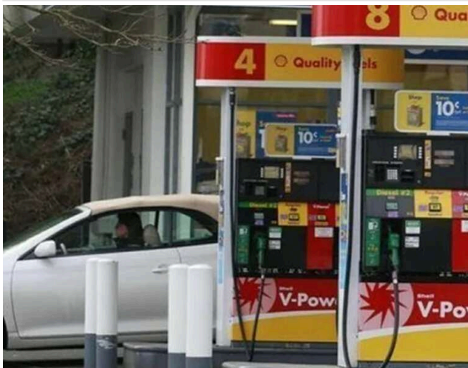
Бензиновий бумеранг: рекордна за 2 роки інфляція в США б'є по рейтингах республіканців