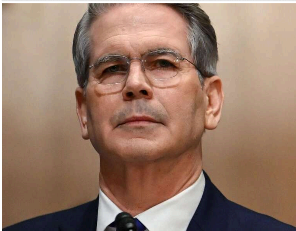
Торговельні війни та підготовка до Пекіна: міністр фінансів США Бессент розкритикував нові правила КНР перед візитом Трампа