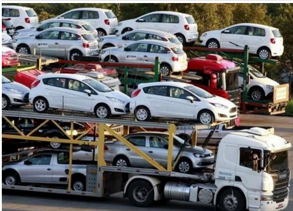
149 авто за фальшивими сертифікатами: волинського бізнесмена оштрафували на 9 мільйонів за обман митниці

Велика схема з авто на Волині: 149 машин за фальшивими документами та штраф у 9 мільйонів.