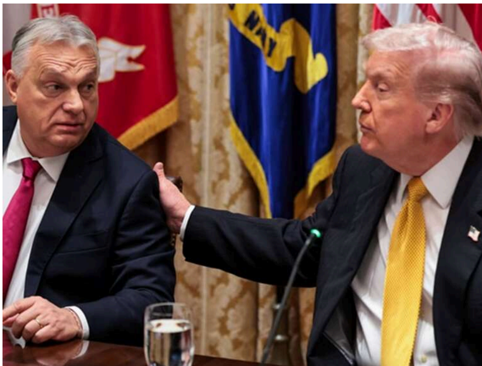
Ставка, що не зіграла: поразку Орбана сприймають як дипломатичний удар по адміністрації Трампа, - CNN

Джей Ді Венс наголошував, що адміністрація Дональда Трампа готова співпрацювати з будь-ким, хто переможе на виборах в Угорщині.