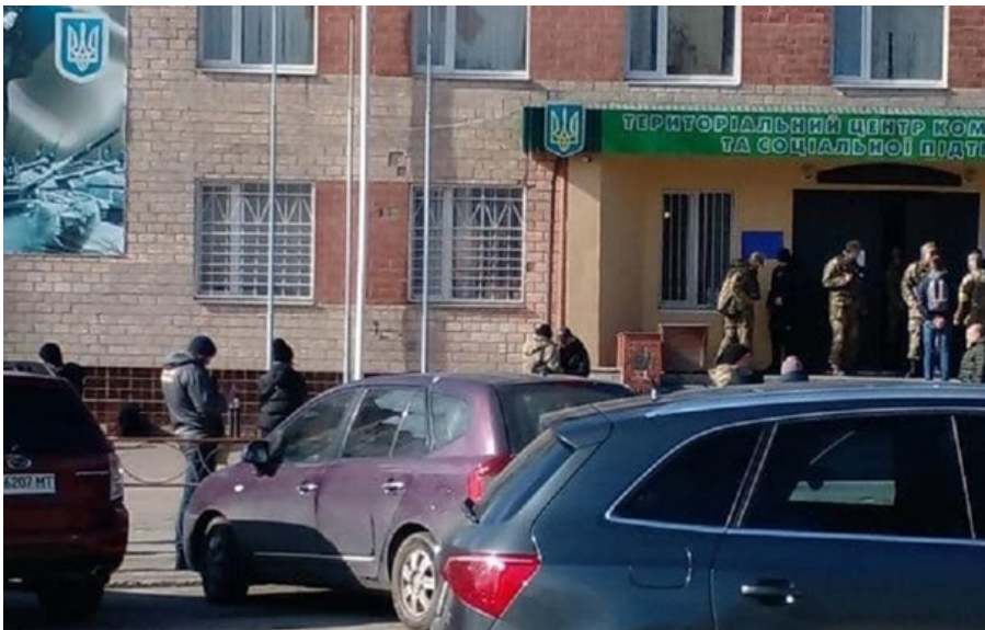
Внаслідок вибуху ніхто не постраждав (ілюстративне фото)