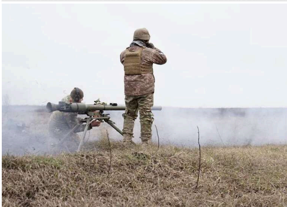
Ситуація на фронті: зафіксовано 55 атак ворога від початку доби