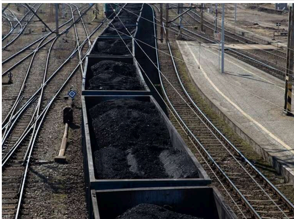
Диверсія на залізниці в РФ: партизани «АТЕШ» знищили теплотяг на важливому логістичному вузлі під Ростовом

Партизани заявили про проведення диверсії на залізниці в Ростовській області РФ, внаслідок якої поблизу станції Лиховська було знищено теплотяг, що використовувався окупантами.