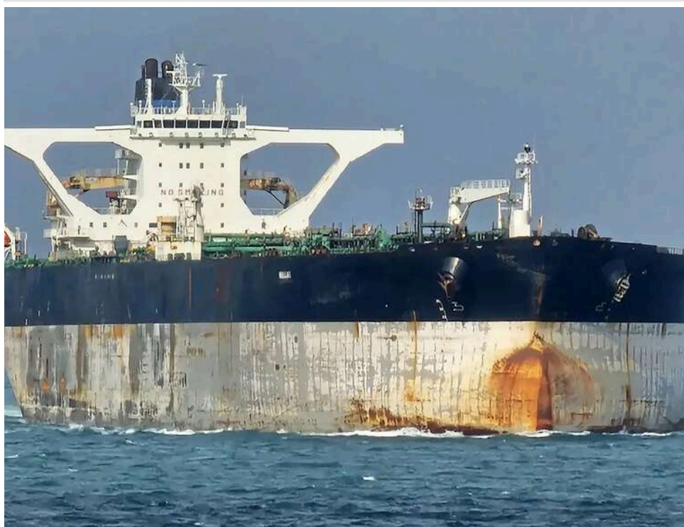
Конфіскація як нова зброя проти «тіньового флоту»: Україна закликає світ масштабувати досвід Швеції

Після конфіскації Швецією судна з викраденим українським зерном Україна закликала інші держави застосовувати аналогічні системні заходи для блокування незаконного вивозу ресурсів з територій, окупованих РФ.