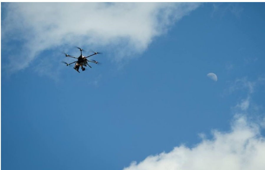
Дрони допомагають стримувати навалу рашистів

Росіяни поки не проводили атаквальних дій на Північно-Слобожанському, Курському, Краматорському і Оріхівському напрямках.