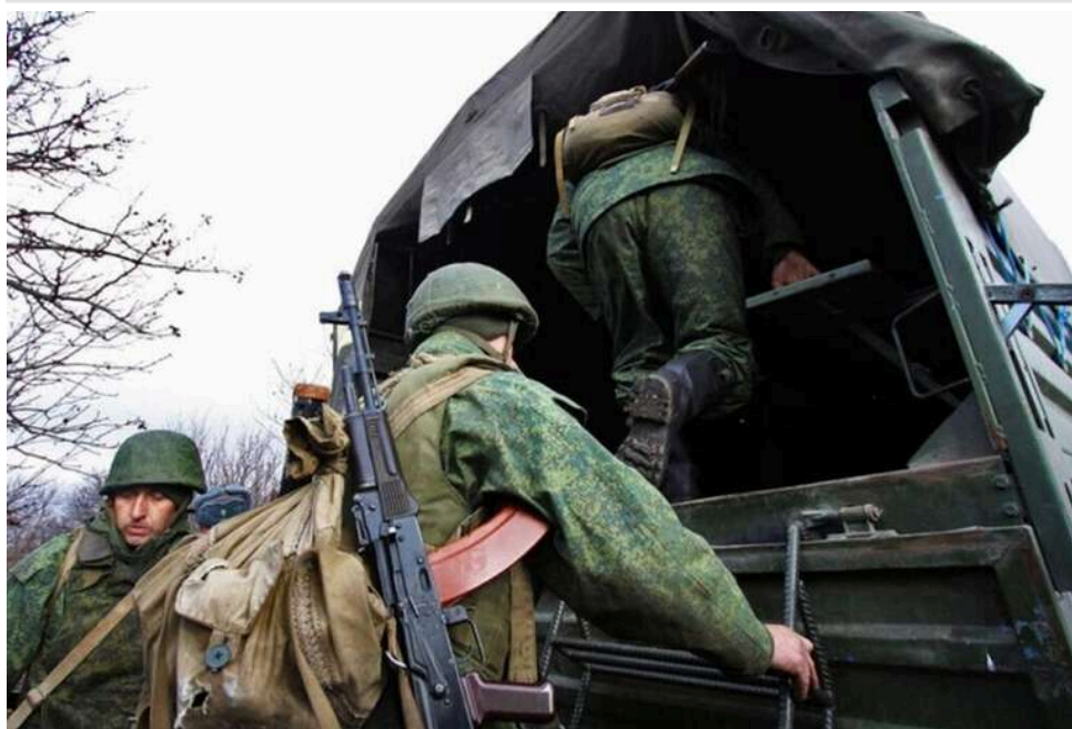
«Своїх не кидають, а вбивають»: росіяни ударами FPV-дронів ліквідували групу власних полонених у Часовому Яру

Російські окупанти під час дії Великоднього перемир'я ударами FPV-дронів вбили у Часовому Яру трьох своїх же військових, які потрапили у полон та були перевдягнені у нейтральну форму одягу.