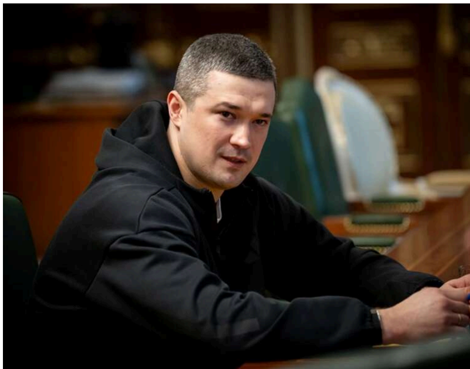
Дрони замість ракет: Україна та Норвегія створюють «мале ППО» для боротьби з російськими БПЛА

Україна і Норвегія узгодили основні напрями оборонної кооперації, акцентувавши на зміцненні протиповітряної оборони та регулярному забезпеченні фронту дронами.