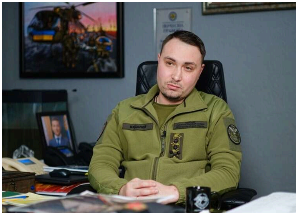
Буданов попередив про наближення «тригерної події», яка може стати катастрофою без єдності в Україні