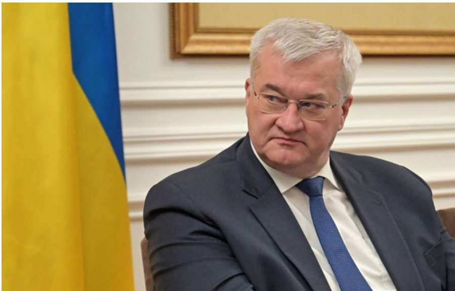
Андрій Сибіга прокоментував рішення ізраїльської компанії

У МЗС вважають рішення ізраїльської компанії сигналом ефективності санкційного та дипломатичного тиску на російський "тіньовий флот".