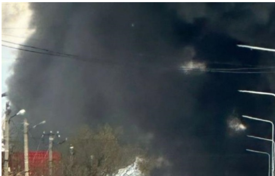
РФ атакувала Дніпро

Внаслідок удару зайнялися магазин та автомобілі поруч. Через атаку по Дніпру одна людина загинула, ще одна - дістала поранень.