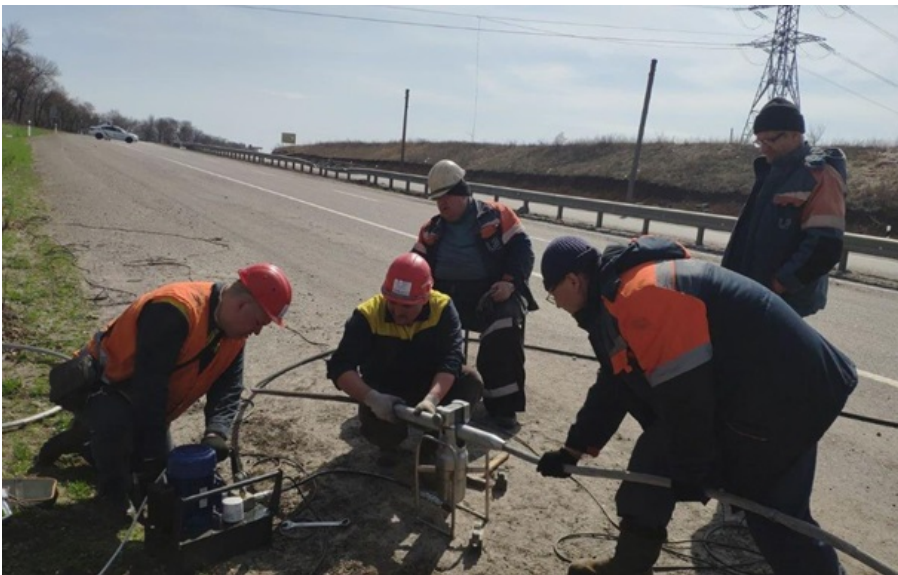
В енергетиків додалося роботи після нових атак рашистів

Аварійно-відновлювальні роботи вже розпочаті там, де це дозволяють безпекові умови, запевнили енергетики.