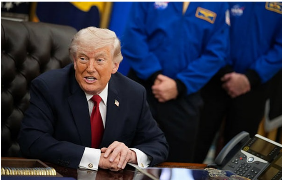
Президент США Дональд Трамп

Американський президент підтримав такий крок і бачить у ньому позитив для здешевлення енергоносіїв.