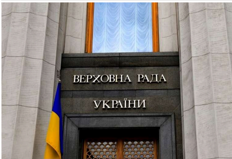
Верховна Рада підтримала законопроект про відновлення конкурсів на держслужбу

Верховна Рада 29 квітня підтримала за основу з урахуванням пропозицій, викладених у висновку головного комітету, та з доопрацюванням положень відповідно до ч.1 ст.116 законопроект № 13478-1, який передбачає відновлення проведення конкурсів для вступу на державну службу та вдосконалення порядку її проходження та припинення.