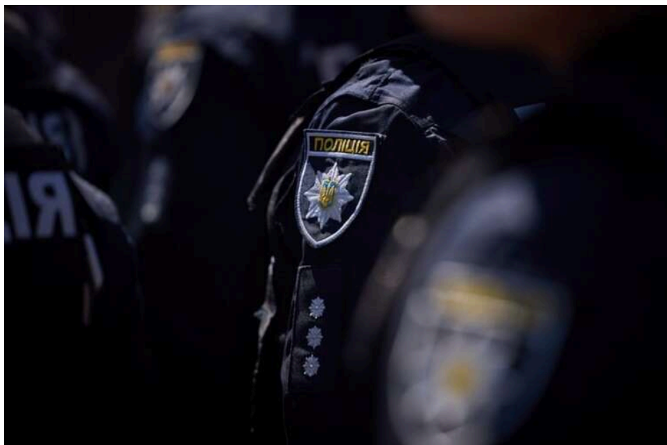
Ціна бездіяльності: чому теракт у Голосіївському районі став вироком недореформованій поліції

18 квітня у Голосіївському районі Києва стався теракт із масовими жертвами: загинуло семеро людей, щонайменше чотирнадцять отримали поранення. Двом поліцейським оголошено підозру – за версією слідства, вони покинули місце подій, залишивши цивільних без захисту.