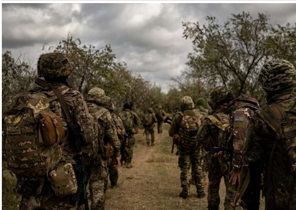
Ситуація на фронті: 137 боєзіткнень за добу, ворог масовано атакує на Покровському та Костянтинівському напрямках

Від початку доби, 29 квітня, на фронті сталося 137 бойових зіткнень.