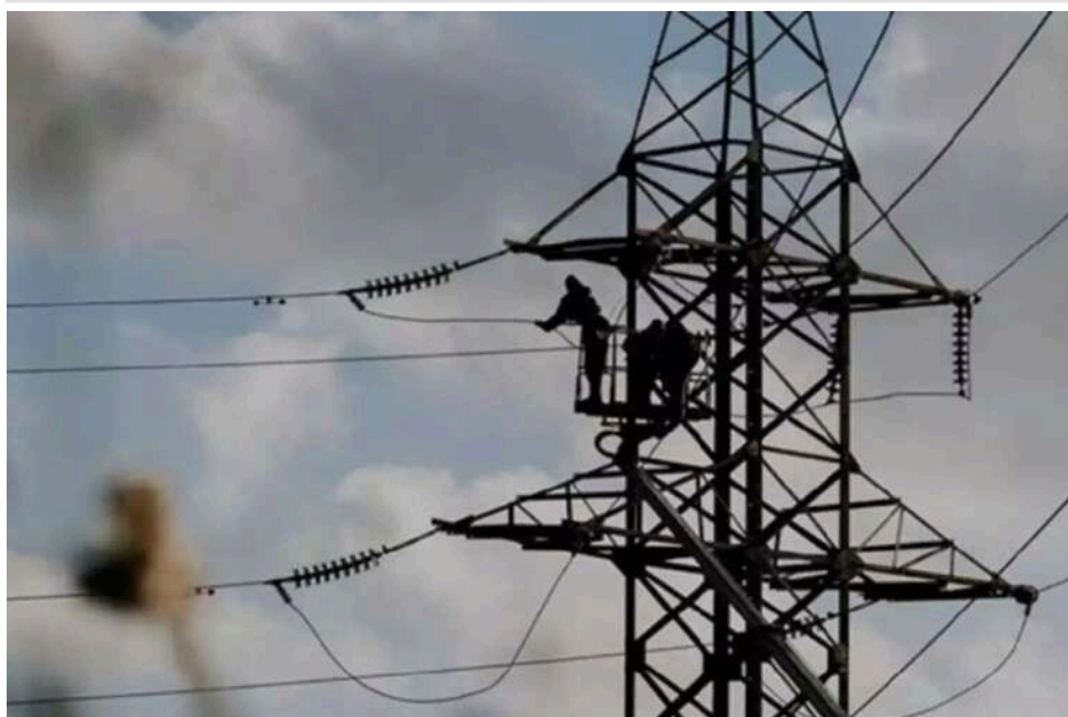
Кабмін продовжив дію тарифу на електроенергію для населення до жовтня 2026 року

Кабінет міністрів не піднімає тарифи на електроенергію для населення ще протягом шести місяців.