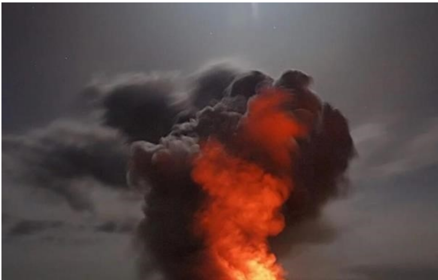
(ілюстративне фото) ЗСУ уразили низку об'єктів росіян

Сили оборони України вчора та в ніч на 29 квітня уразили низку об'єктів російської армії в Криму та на Курщині.