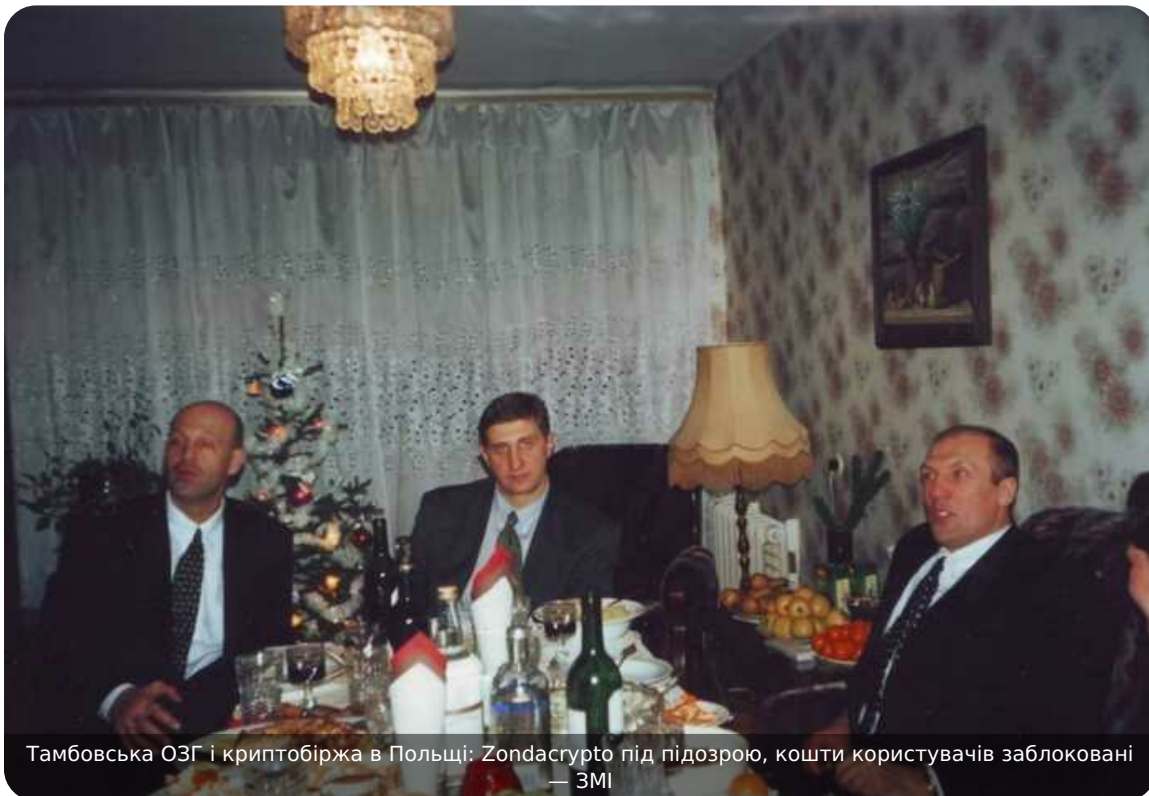
Тамбовська ОЗГ і криптобіржа в Польщі: Zondacrypto під підозрою, кошти користувачів заблоковані — ЗМІ

Одна з найвідоміших кримінальних структур РФ — так звана «Тамбовська» ОЗУ — може бути пов'язана з контролем польської криптобіржі Zondacrypto.