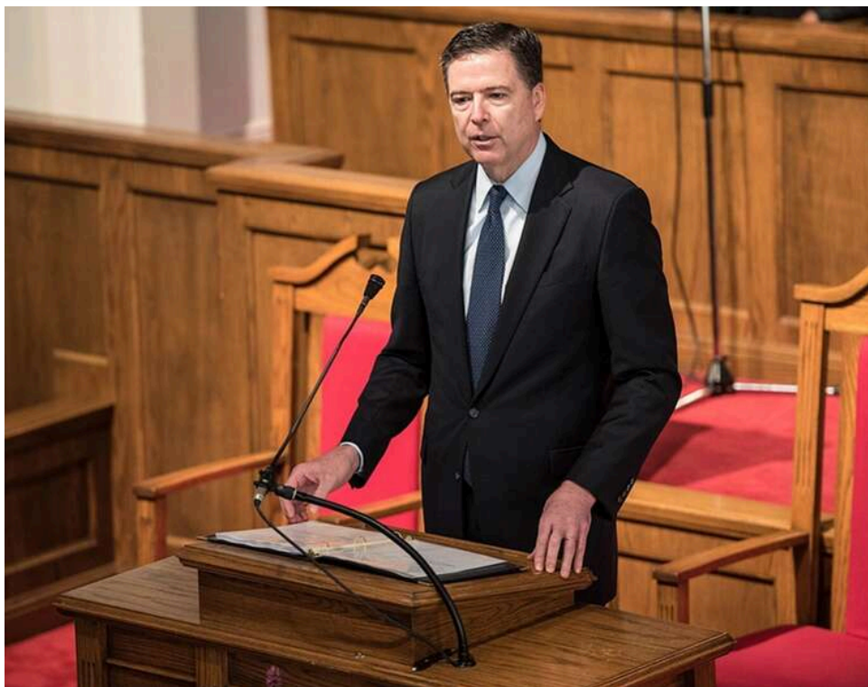
Погроза Трампу: Ексдиректору ФБР Джеймсу Комі висунули звинувачення через зашифроване фото в Instagram

У США колишньому директору ФБР Джеймсу Комі висунули обвинувачення в погрозі життю президента Трампа через фото в Instagram.