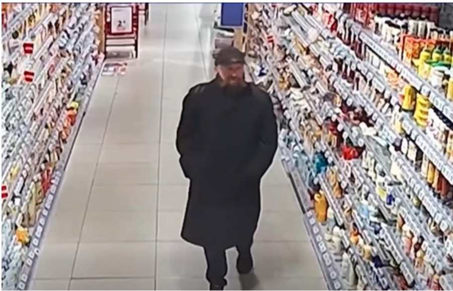
Чоловік залишив вибуховий пристрій на полиці супермаркету

Пристрій серед товарів залишив невідомий чоловік, а магазин працював у звичайному режимі.