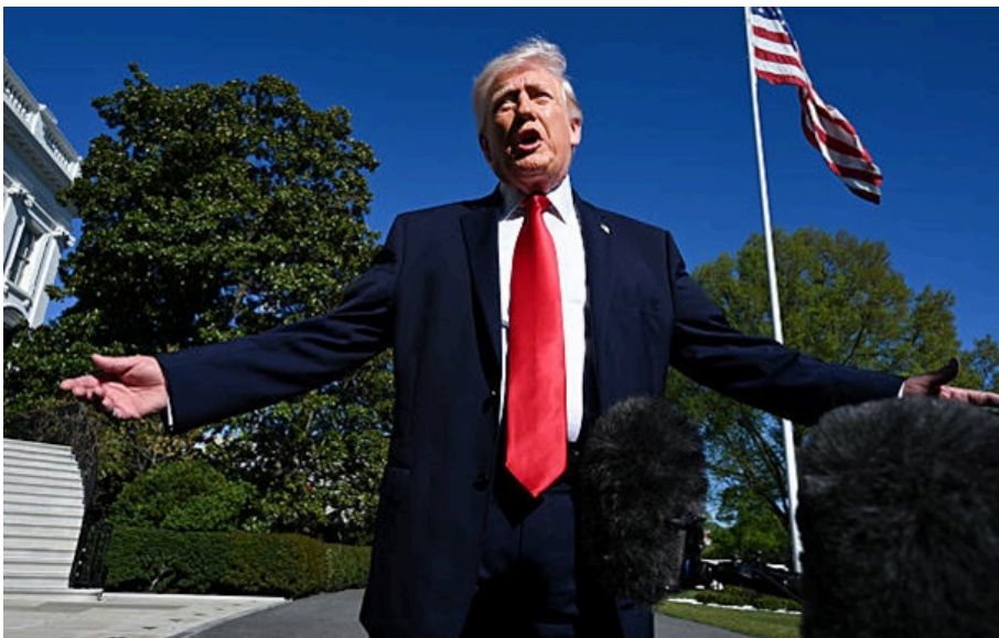
Президент США Дональд Трамп

Журналістка Fox News Марія Бартіромо після інтерв'ю з Трампом пообіцяла надати деталі розмови з президентом США та його заяви.