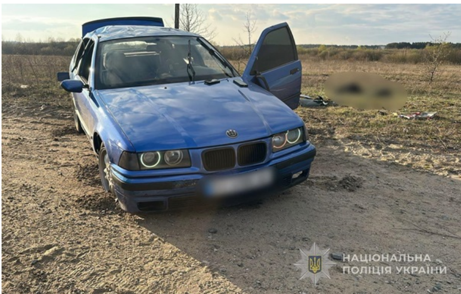
Аварія сталася між селами Хоцунь та Сваловичі

17-річний водій BMW не впорався з керуванням і з'їхав на узбіччя дороги. Авто кілька разів перевернулось.