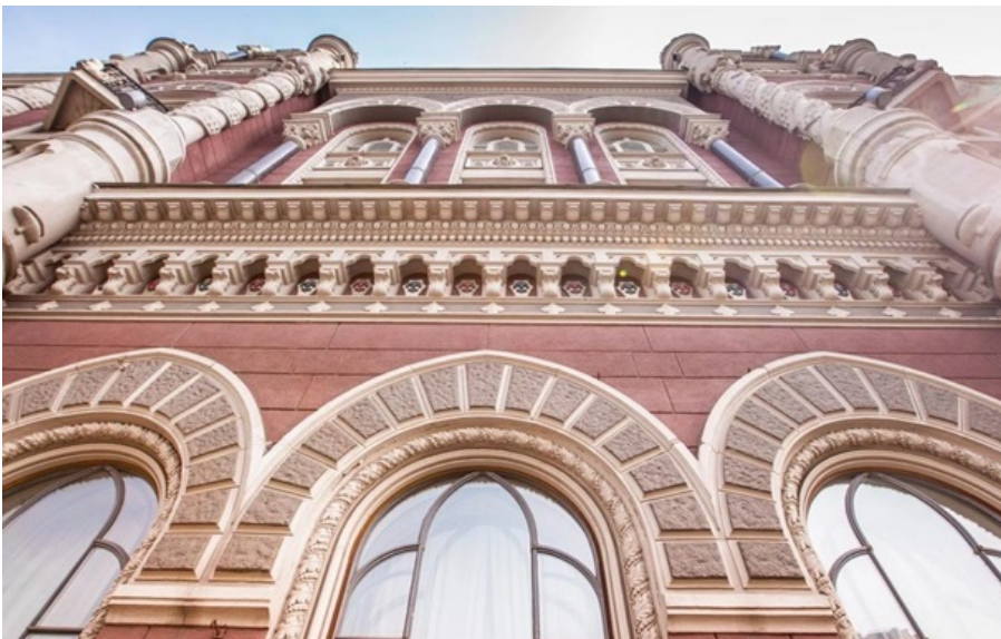
Нацбанк зміцнив курс гривні на 29 квітня

На міжбанку американська валюта додала в ціні 1 копійку і тепер перебуває на рівні 44,08-44,11 грн/долар купівля-продаж.