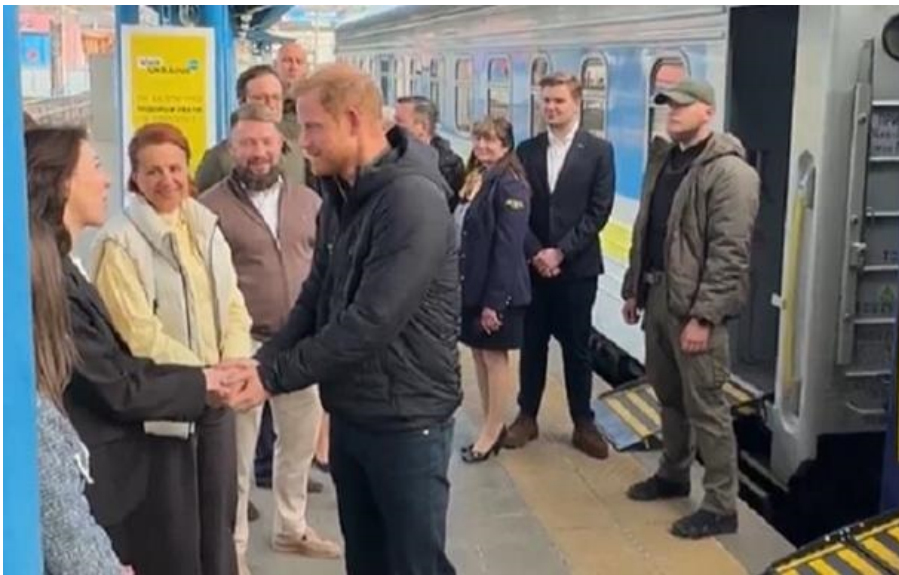
Принц Гаррі назвав Україну "глобальним інноватором"

Дії України сьогодні - це не лише героїчний опір, а й прояв справжнього світового лідерства, переконаний герцог Сассекський.