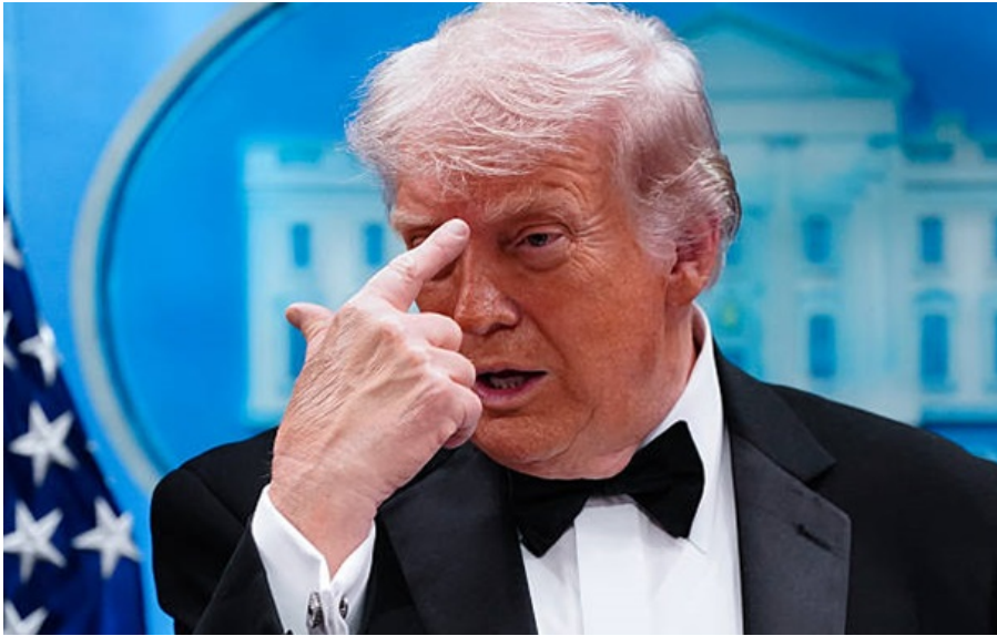
Президент США Дональд Трамп

З моменту вступу на посаду чинний глава США розмістив своє зображення та підпис на низці федеральних будівель, програм тощо.