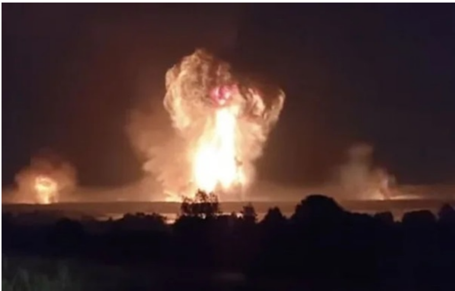
Крим опинився під масованою атакою безпілотників

Російські військові намагалися оперативно підняти авіацію, щоб евакуювати її з-під можливих ударів.