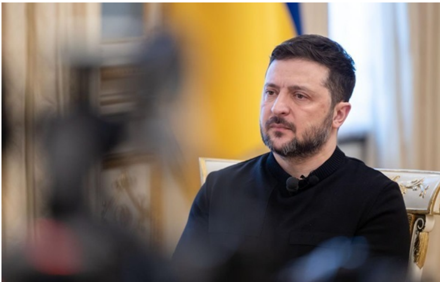
Президент України Володимир Зеленський назвав неповагою поїздки Віткоффа і Кушнера в Москву, а не в Київ

Загалом Віткофф був у Москві вже вісім разів і постійно зустрічався з воєнним злочинцем Путіним, натомість до Києва ключові американські переговарники не приїздили.