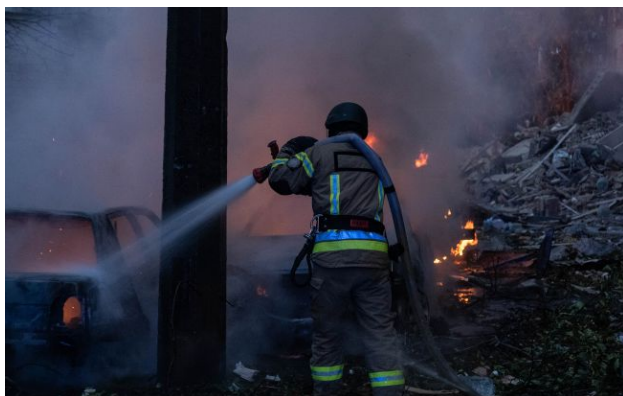
Фото: наслідки російської атаки уточнюються (facebook.com/DSNSKyiv)

Вночі 29 квітня окупанти атакували Шосткинську громаду на Сумщині та Харківщину. На Сумщині від отруєння чадним газом загинула 60-річна жінка, ще двоє людей постраждали. На Харківщині пошкоджено житлові будинки в кількох районах.