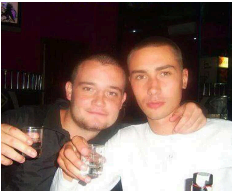
«З дитинства мріяв про армію»: у мережі показали фото 17-річного Кирила Буданова перед вступом до вишу

В інтернеті з'явилось рідкісне архівне фото Кирила Буданова, керівника Офісу Президента. На знімку колишній голова ГУР ще дуже юний.