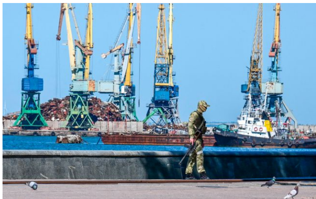
Фото: російські військові (GettyImages)

Росія використовує комплексні методи розвідки для відстеження ситуації на території України, включно з аналізом відкритих джерел і роботою агентури.